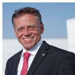
Hans-Jürgen Petrauschke Landrat Rhein-Kreis Neuss

Zu guter Letzt wird der Themenkomplex „Datensicherheit und Datenschutz“ besprochen.