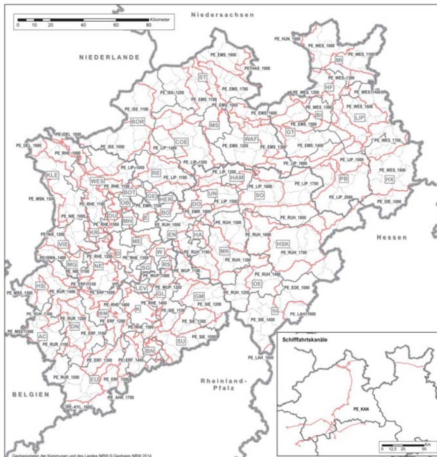
Planungseinheiten und Verwaltungsgrenzen in NRW