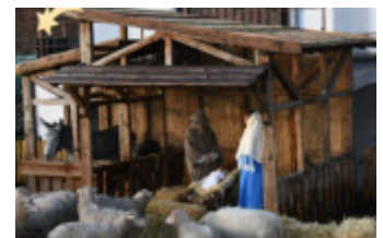
Lebende Krippe Zons

Seit 16 Jahren führen ca. 35 bis 40 Vereinsmitglieder (zusätzlich 8 bis 10 Kinder) die „Lebende Krippe Zons“ auf. In Zusammenarbeit mit dem Kulturbüro der Stadt Dormagen seit neun Jahren auf der Zonser Freilichtbühne. Gespielt wird die Geschichte von Bethlehem nach Texten des Lukas Evangeliums (siehe Flyer). Bei freiem Eintritt werden Spenden für karitative