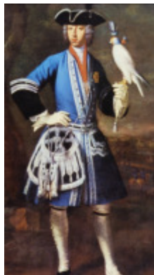
Erzbischof Clemens August als Falkner in Zons