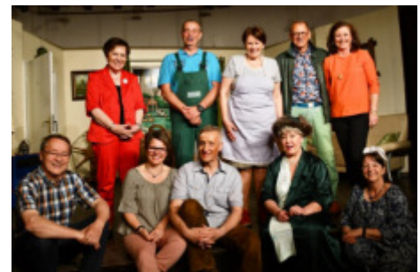
Das Projektteam „Mundarttheater“

Nächstes Stück: „Kreuzfahrt im Schweinestall“ Proben: zur Zeit in der TouristInfo Premiere: 22. April 2020