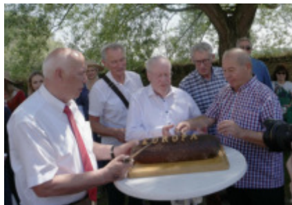
Erster Anschnitt des Zonser Europabrot

Nach alten Zonser Rezepturen versuchen wir zurzeit -wie Anno dazumal- Brot in einem Steinofen nachzubacken. So haben wir gleichermaßen Rezepturen aus dem 18.