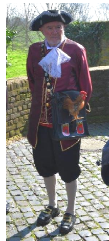
KuHF-Stadtführer als Clemens August

Seit dem 7. Jahrhundert gehört Zons zum Kölner Erzbistum. Obwohl bereits viele Heimatforscher sich intensiv mit der Zonser Geschichte befasst haben, stellen wir immer wieder bisher unbekannte Zusammenhänge zwischen den ehemals handelnden Personen fest. So hat unsere Projektgruppe erstmalig herausgefunden, dass der große Kölner Erzbischof Clemens August von Bayern, der Enkelsohn des legendären polnischen Königs Jan III Sobieski (Befreier von Wien) war (siehe Anlage 1). So war er etliche Male als Falkner in Zons, er war zweimal Zonser Schützenkönig (1739 und 1741) und hat u.a. der kath. Kirche Nievenheim den von seinem Hofbaumeister Johann Conrad Schlaun konzipierten Mittelaltar gestiftet.